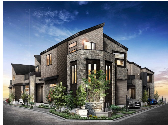
レーベンプラッツ保谷Ⅳ

戸建の魅力+マンションの快適性を兼ね備えた 「誰もが無理なく安心して購入できる理想の住まい」と 「高品質で購入しやすい価格」を実現する「レーベンプラッツ」。 地震対策や太陽光発電システムをはじめとした 住環境へのこだわりはもとより、先進の機能性とデザイン性を高めた MIRARTHホールディングスグループならではの 住まいを提案し続けております。