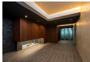
マンション〈施工例〉