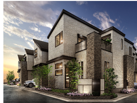
レーベンプラッツ平和台