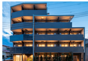
マンション〈施工例〉