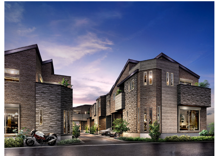
レーベンプラッツ瑞江Ⅶ