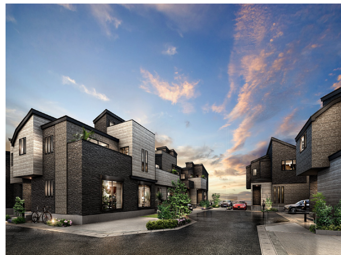
レーベンプラッツ松戸