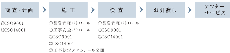
商業ビル・施設〈施工例〉

お客さまの満足と信頼を得るために、積み重ねてきた確かな技術とノウハウをもとにした 独自の品質管理パトロールの実施、品質や環境負荷軽減における国際規格認証の取得、 工事状況の公開、さらにはアフターサービス体制の確立など、計画段階から施工、お引き渡しまで、 すべてのプロセスで徹底した品質管理を実施しています。