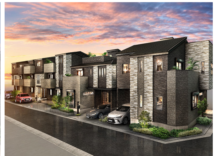
レーベンプラッツ葛西Ⅹ