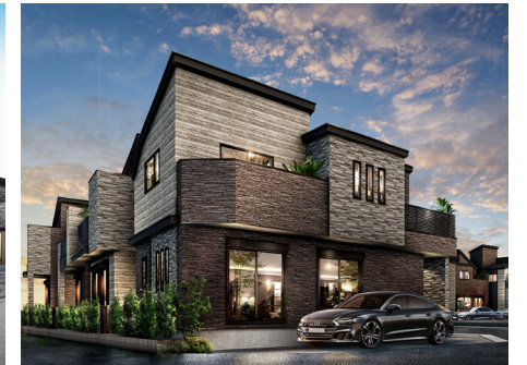
レーベンプラッツ新所沢Ⅱ