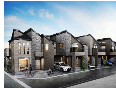
レーベンプラッツ葛西Ⅶ